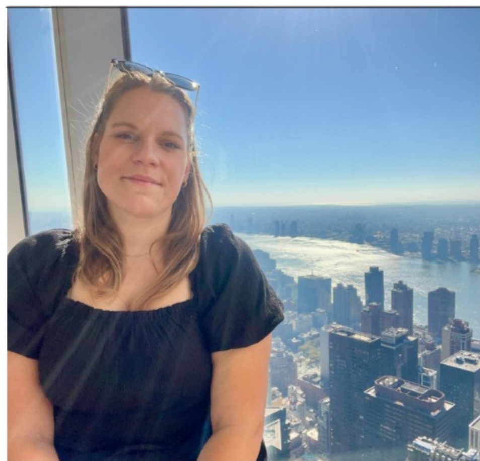
BWL & DEUTSCH GRUPPE 4