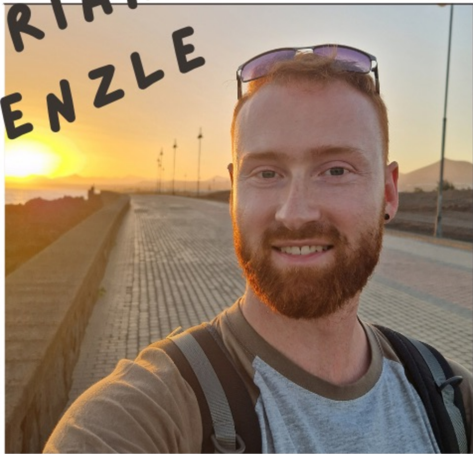
FERTIGUNGSTECHNIK & ETHIK GRUPPE 1