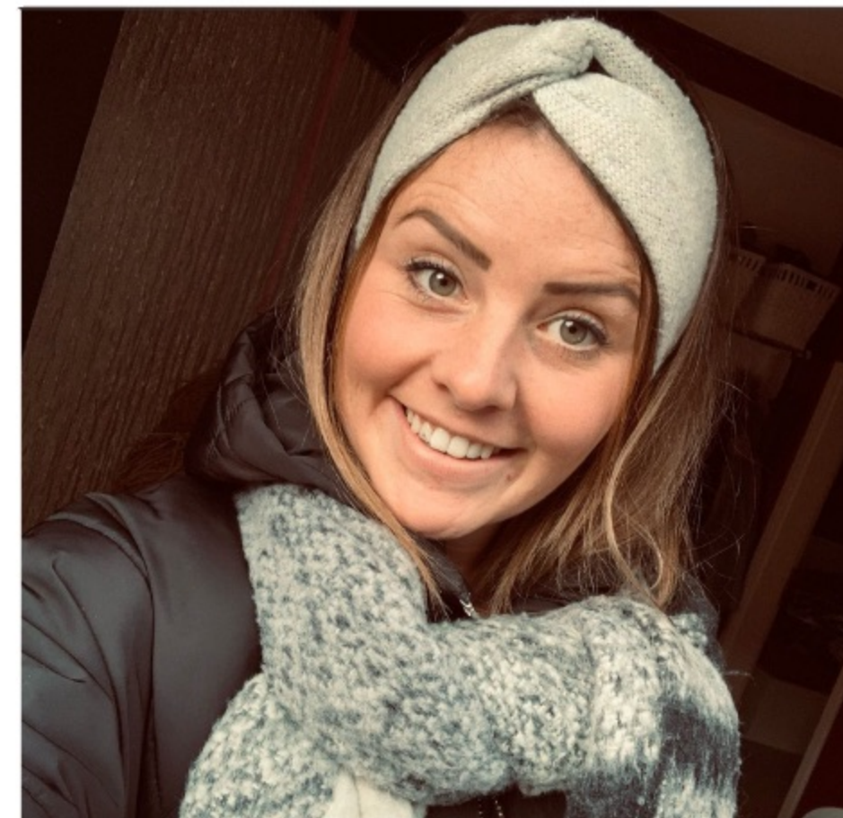
BWL & VWL GRUPPE 5